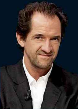
STÉPHANE DE GROODT

Leader d'Action Discrète (Canal +), il s'est spécialisé dans les micro-trottoirs et les sketches politico-absurdes.